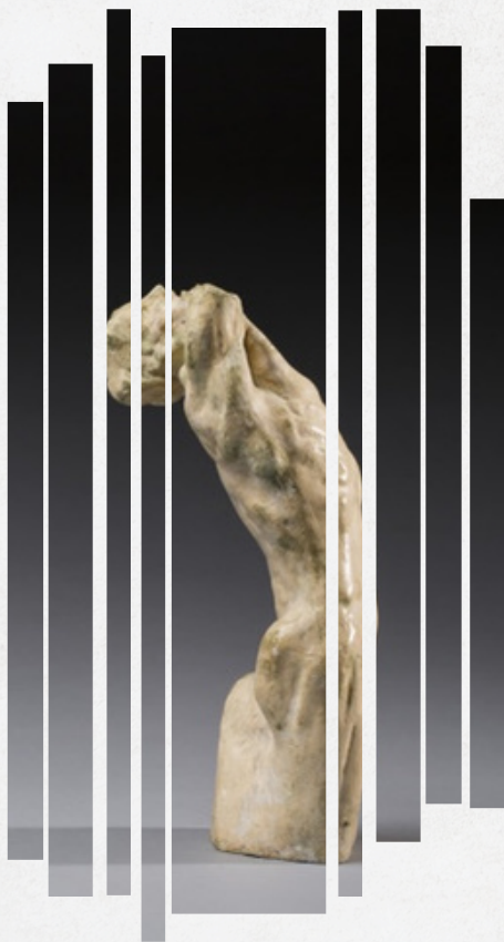
Torse de l'adolescent désespéré - Auguste Rodin

Tout d'abord, selon l'idée défendue par la Compagnie En Place de pouvoir assurer des représentations dans des lieux normalement inadaptés, ce spectacle a été réfléchi dans de nombreuses dispositions. En effet, la représentation peut s'effectuer avec un dispositif frontal, bi-frontal, tri-frontal, quadri-frontal, et circulaire.