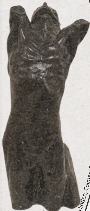
Torse de l'adolescent désespéré - Auguste Rodin - Musée Unterlinden, Colmar (68)

Aujourd'hui j'ai 17 ans, demain 30, et bientôt 80. À 80 ans, je veux me dire que le monde est beau, et que l'humain l'est aussi. À 30 ans, je m'en convaincrai. À 17 ans, je fais partie de ceux qui aiment, avec un grand cœur et qui aident, en parlant quelques heures. Si l'humain est beau, on peut bien espérer. J'espère, je dis des choses folles. Ces folies je les rêve. Ces folies je les crie. Elles me libèrent. Elles font de ma vie d'avant les fondations. Elles sont de ma vie les piliers Qui soutiennent mon regard au delà Des murs de l'enceinte de l'adolescence.