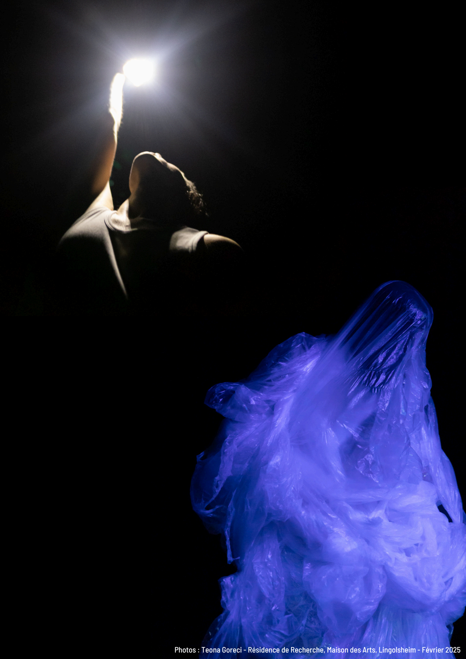
Photos : Teona Goreci - Résidence de Recherche, Maison des Arts, Lingolsheim - Février 2025